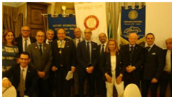
CONSIGLIO DIRETTIVO 2018 - 2019