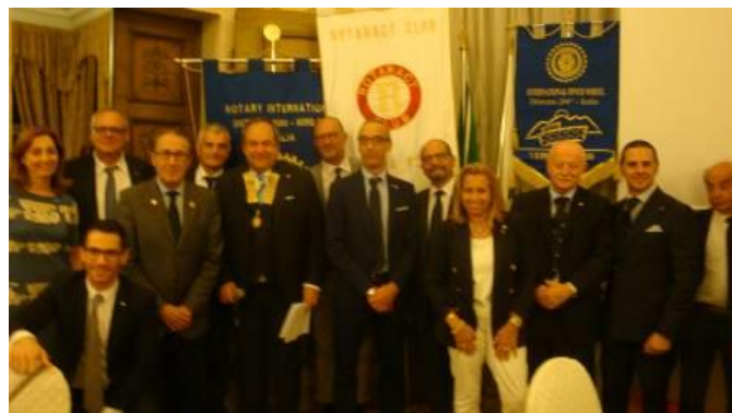
CONSIGLIO DIRETTIVO 2018 - 2019